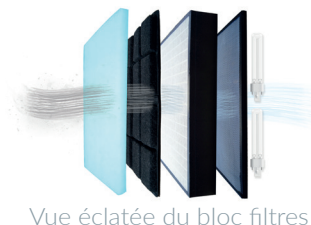
Vue éclatée du bloc filtres